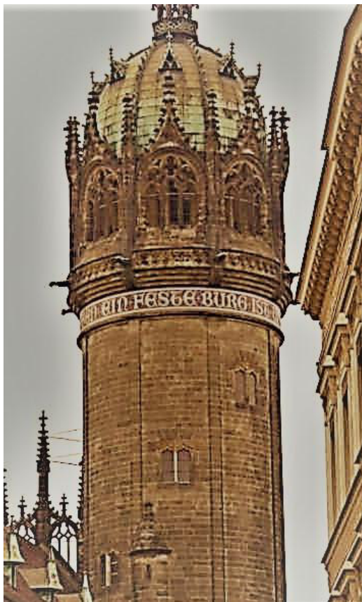
Ein feste Burg... (Turm der Schlosskirche zu Wittenberg)