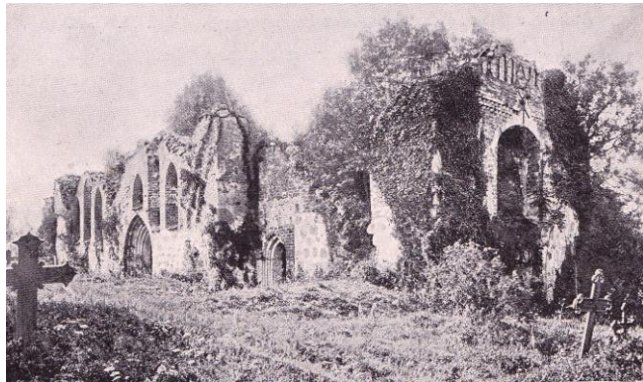
Alte Satower Kirche, Aufnahme vor 1901